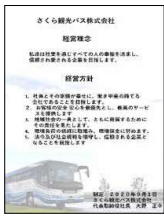
■経営理念・経営方針

さくら観光バス様は、埼玉県を中心に観光バスや送迎バス、路線バス等の事業を展開しています。コロナ禍の時期に旅客業という経済影響の大きい業種ではありますが、このような時こそ、経営マネジメントシステムをしっかりと構築することが重要であると考えられました。同社は貸切バス事業者安全性評価認定制度にて、三ツ星の優良事業者と認定されていますが、これに満足することなくお客様がより安心して、快適にバスに乗れるよう各種取り組みを行い、さらに持続できる経営と社会へのインパクトを意図してエコステージによる経営マネジメントシステムの構築と、同時にSDGs活動を行うことにしました。