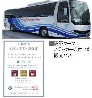
■SDGs見える化サービスの企画・実施